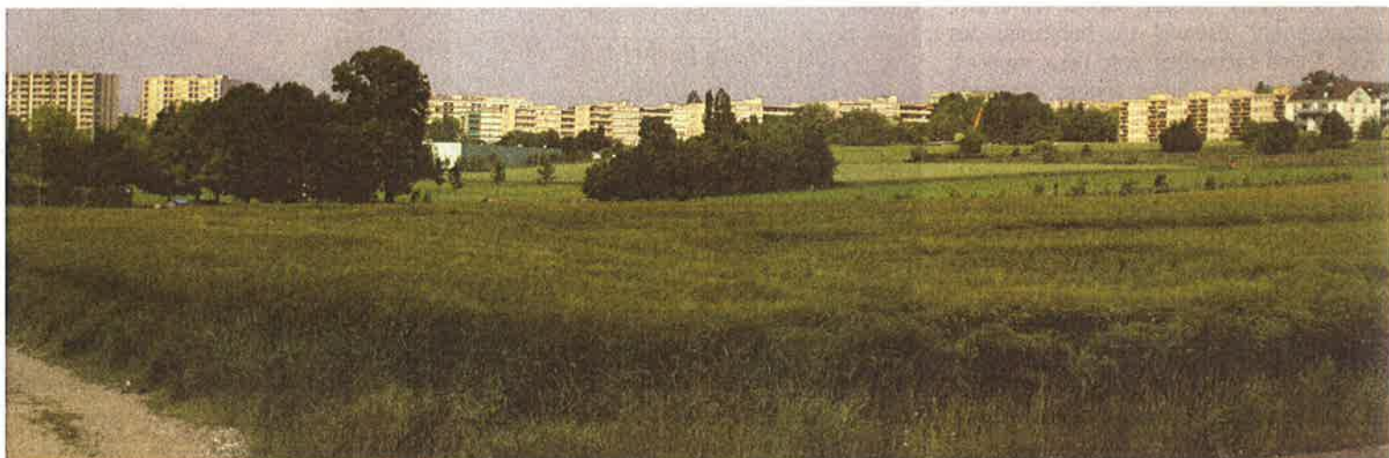
Une parcelle bien située.